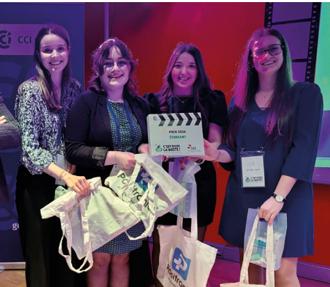
Le prix de l'Entreprise en herbe a été attribué à Créations marines, projet fictif présenté par quatre étudiantes de l'IUT GEA d'Auch.

ont été évalués selon plusieurs critères : pertinence du projet, prise en compte du volet RSE, choix des informations mises en avant, qualité d'élocution, qualité des vidéos produites... A l'issue d'échanges et débats, deux prix ont été attribués : celui du Créateur/Repreneur et celui de la Jeune entreprise. Le prix Coup de cœur du public a été décerné à l'entreprise qui a obtenu le plus de «likes» de sa vidéo sur la playlist YouTube du concours. Cette année, trois groupes d'étudiants de l'IUT GEA d'Auch sont montés sur scène pour pitcher un projet fictif, afin de décrocher le prix de l'Entreprise en herbe.