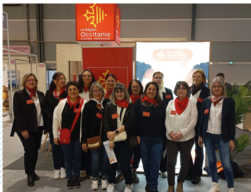
Les stagiaires de la formation "Chargé d'accueil et de gestion administrative" ont été mobilisées lors du salon TAF.

Dans le cadre de ses actions en faveur de l'emploi et de la formation, CCI Formation Gers a participé le 25 mars au salon TAF, organisé par la Région Occitanie à la salle du Mouzon à Auch.